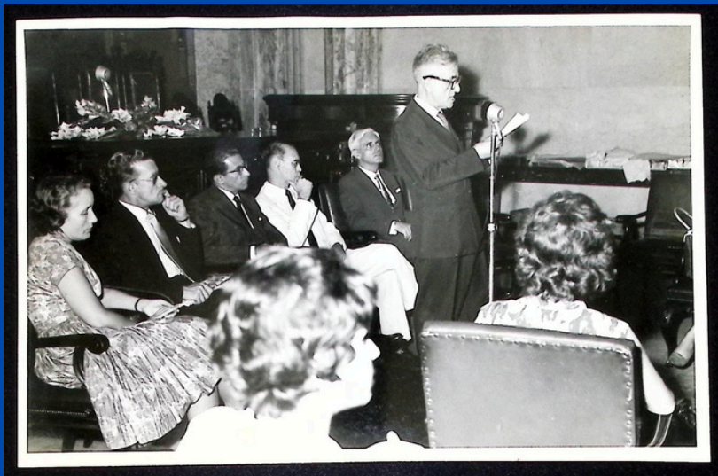
Comemoração ao Dia do Mestre na FNFi (1944)